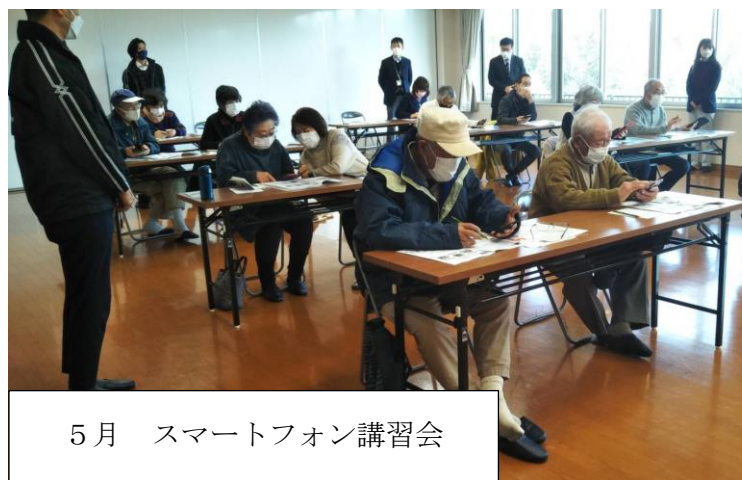
5月 スマートフォン講習会