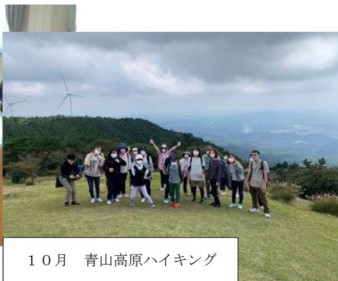
10月 青山高原ハイキング