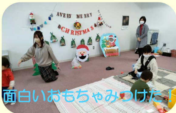
面白いおもちゃみつけた！