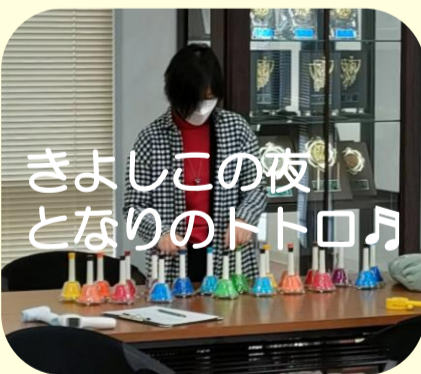
きよしこの夜 となりのトトロ♪