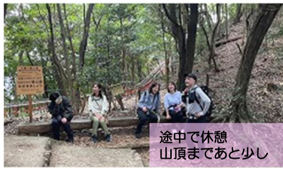
途中で休憩 山頂まであと少し