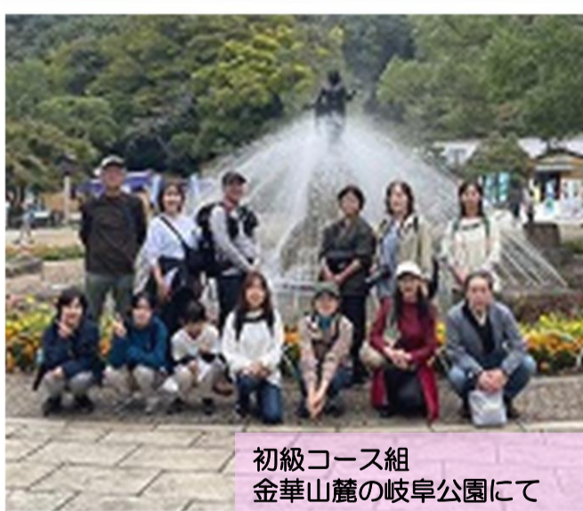
初級コース組 金華山麓の岐阜公園にて