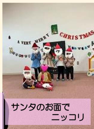
サンタのお面でニッコリ