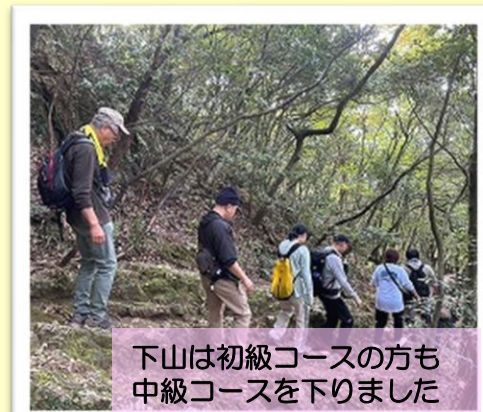
下山は初級コースの方も 中級コースを下りました