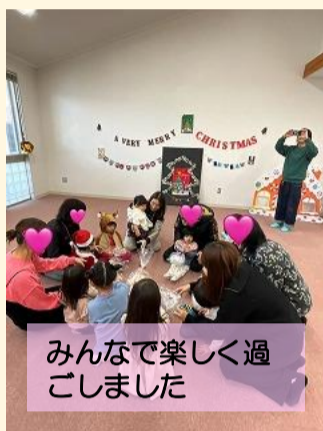
みんなで楽しく過ごしました

1時間の短い時間でしたが、子どもたちが嬉しそうにクリスマスの歌を歌ったりして遊ぶ姿は微笑ましい光景でした。