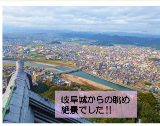
岐阜城からの眺め 絶景でした!!