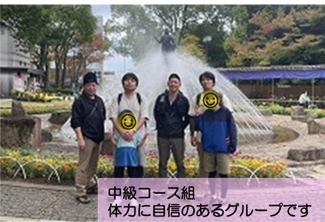
中級コース組 体力に自信のあるグループです