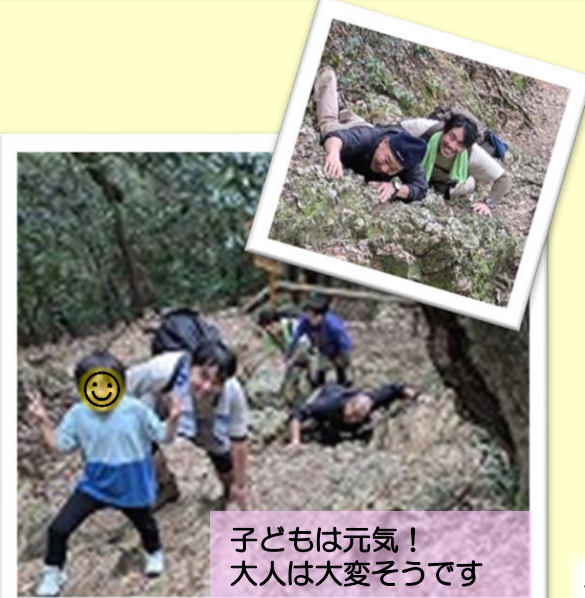
子どもは元気! 大人は大変そうです