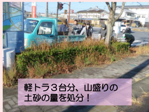
軽トラ3台分、山盛りの土砂の量を処分！