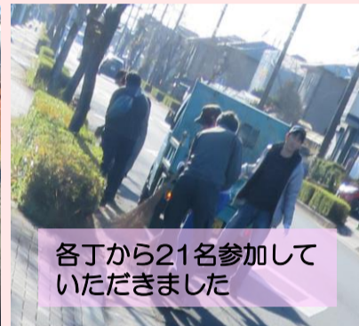
各丁から21名参加していただきました