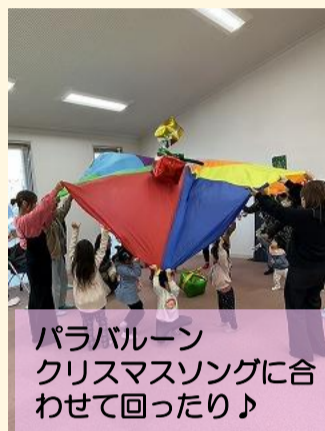
パラバルーン クリスマスソングに合わせて回ったり♪