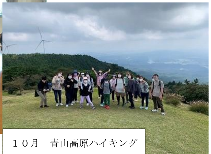
10月 青山高原ハイキング